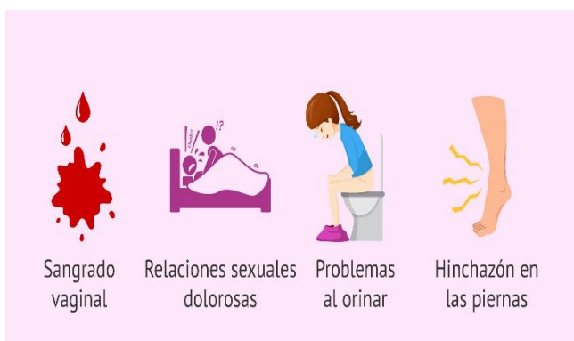
Ilustración 1 Francos Pérez Alicia (29/05/2025) Cáncer de cuello de útero: síntomas, diagnóstico y tratamiento Reproducción Asistida ORG Recuperado el 19/11/2025 de: https://www.reproduccionasistida.org/cancer-de-cuello-de-utero/

Cuando te ves al espejo, tu mirada perdida refleja cansancio y tristeza, tu sonrisa antes brillante comienza apagarse, mientras tu mente te muestra recuerdos de aquel día donde